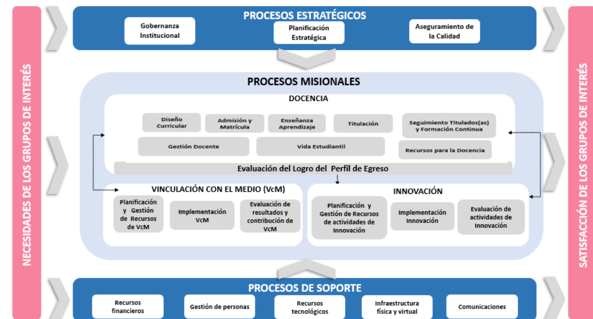
Diagrama. Mapa de Procesos IPCHILE

IPCHILE define un mapa de procesos que ilustra las relaciones e interacciones con que se desarrolla el quehacer institucional para el cumplimiento de cada una de las funciones institucionales con el propósito de dar operatividad a la gestión, control y monitoreo sistemático sobre los diversos procesos que dispone la institución para cumplir con los objetivos previamente definidos. Se basa en una gestión por procesos que permite una mirada transversal al funcionamiento del SIAC, a través del análisis y revisión de la ejecución de los procesos.